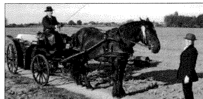
...en nog een foto van de Houtlandse Ploegdag...